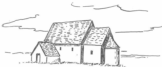
BOSARPS GAMLA KYRKA