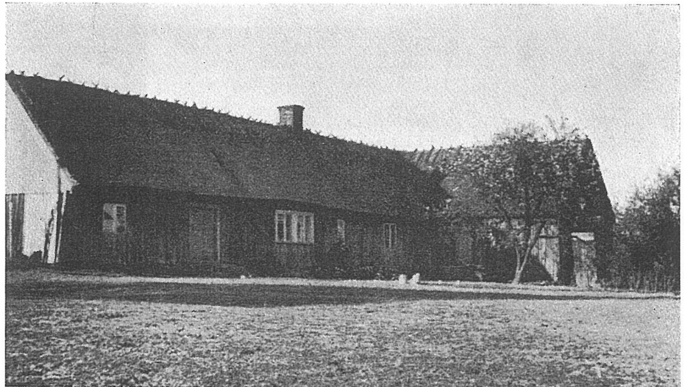
OLA PERSSONS GÅRD, ÖSLÖV NR 7 (FOTO 1944)