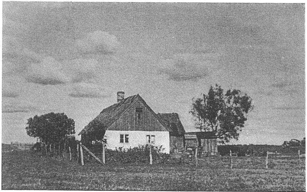
TORP I GÖINGE

Stiagöingen, han som sålde brandstegar, satt alltid överst på sitt stora lass. Hade han inte hästar körde han med oxar. Långsamt gick det, men fram kom han ändå så småningom. Det var ingen brådska på den tiden. Första dagen körde en göing aldrig längre än att han kunde vända om hem igen om så skulle vara. Och sina kreatur kunde han driva ända till Kalmar för att sälja på marknaden där. Då lågo bönderna i massvis på bara golvet på rasteställena. På sträckan Wittsjö—Hässleholm tog man ofta in på Gyllenlunds bondställe och i Hässleholm fick man på den tiden alltid logi hos trävaruhandlaren.